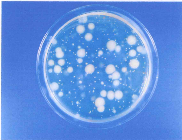
対照 1 分後